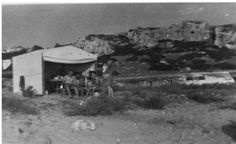
La tenda d'en Tiquiano.

Cada estiu, damunt les dunes, devora el blocus de baix, la família d'en Tiquiano, que habitava la cova de s'Espart, muntava una gran tenda on s'hi passaven el dia. La situació d'aquesta i el tarannà de la família ho convertien en el centre de reunió. Al fosquet, s'hi arplegaven totes les famílies que passaven l'estiu a les coves. Les partides de truc anaven en via, feien qualche gin i festa.