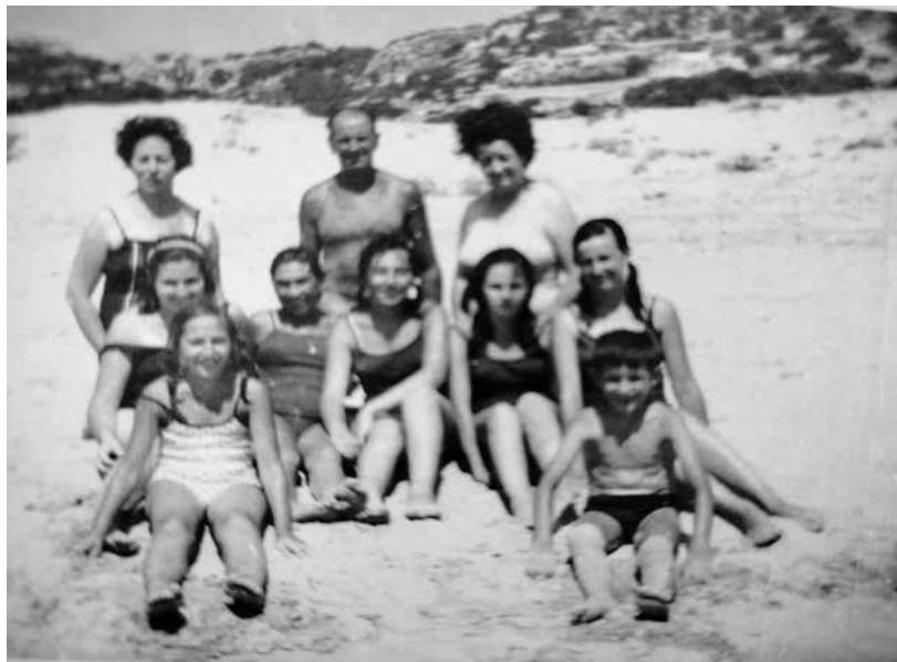
Havien baixat de sa cova Gran a l'arenal.

A més, les famílies solien tenir convidats i a la cova hi havia ambient i anècdotes per fer-ne un lli- bre: de jocs d'al·lots, de festejants, de majors, d'ide- es diverses que hi van conuiu molts estius. A la foto, un grupet que havia baixat a l'arenal a prendre banys.