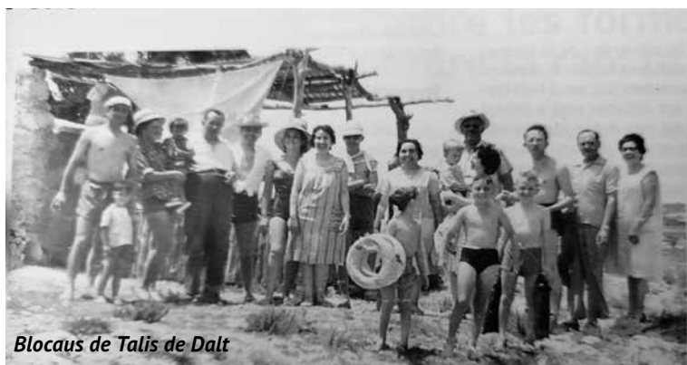
Blocaus de Talis de Dalt