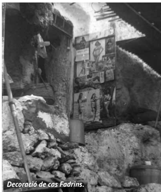
Decoració de cas Fadrins.