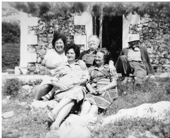
Caseta des sabaters