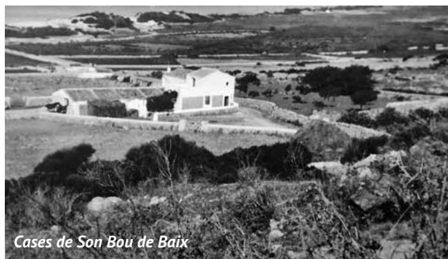
Cases de Son Bou de Baix