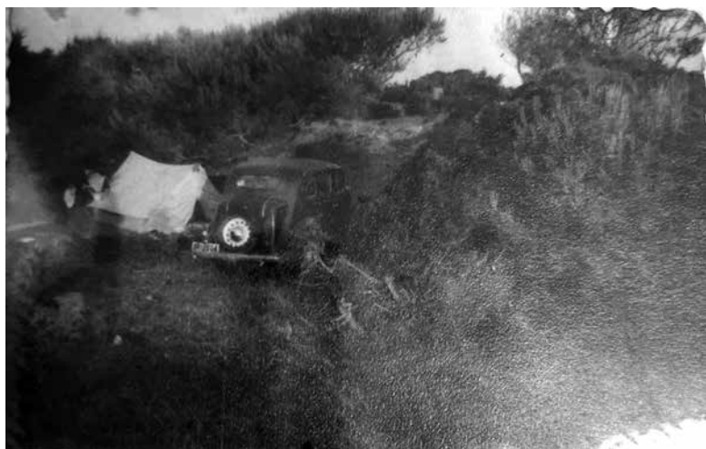
Tenda davall dels pins.