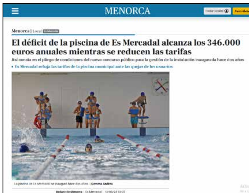
Retall del Diari Menorca digital que exposava el dèficit de la piscina des Mercadal, de només 1.070 m 2 , mentre que la d'Alaior tindrà 2.808 m 2 .