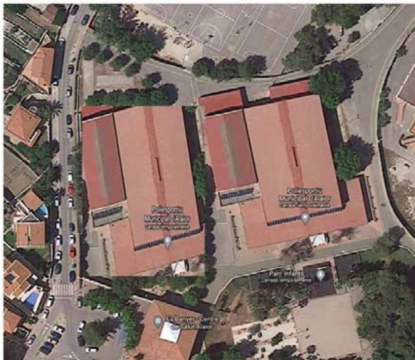
Simulació de l'impacte de l'edifici en una de les zones actuals de més qualitat urbanística, que perdre les funcions de zona verda.

Aquest projecte encadena una sèrie d'errors que l'han decantat d'un projecte més raonable. Des de sempre, tots els càlculs econòmics donen que no serà rendible i que el cost de funcionament serà caríssim. Però la insistència d'alguns polítics han forçat massa les coses. Primer va ser la decisió de situar-la a prop del Poliesportiu a fi d'aprofitar la inèrcia dels usuaris de la resta d'instal·lacions per convertir-los en part en matriculats de la piscina. Açò ja indicava que el públic estimat era insuficient. Aquesta decisió va en perjudici d'afegir equipaments també en altres zones, per exemple a la zona de Cala en Busquets. Després s'hi han afegit, dins la mateixa obra, altres elements com un gimnàs i una segona piscina o sala polivalent per atraure més persones i compensar el dèficit d'usuaris. Tota